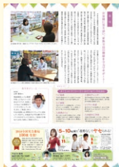
やまさか薬局(2019年vol.36掲載) ■記事型ディスプレイ広告