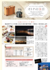
瀬戸内海汽船(2017年vol.27掲載) ■取材型ディスプレイ広告